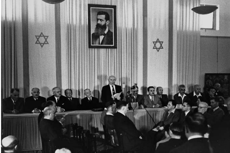
David Ben Gurion liest die Unabhängigkeitserklärung vor (14. Mai 1948).