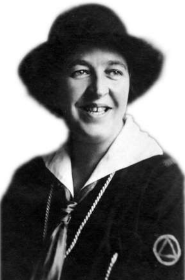
Corrie ten Boom, um 1921

ausgab, und die Gestapo stürmte am 8. Februar 1944 ihr Haus. Obwohl die Gestapo die sechs Personen, die sich an diesem Tag sicher im Geheimzimmer versteckt hielten, nicht fand, verhaftete sie die Familie Ten Boom, die schließlich in Konzentrationslager deportiert wurde, wo alle außer Corrie ums Leben kamen. Casper, der zu diesem Zeitpunkt 84 Jahre