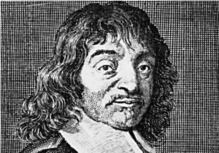
Abbildung 1.2: »Cogito ergo sum« »Ich denke, also bin ich«. Ich kann an allem zweifeln, ja sogar an der Tatsache, dass es Gott gibt oder dass die Welt existiert, aber an einer Sache kann ich nicht zweifeln, nämlich dass ich in diesem Augenblick zweifle.« In der Nacht vom 10. zum 11. November 1619 fährt René Descartes dieser Gedanke wie ein Blitz durch den Kopf, und seither hat nicht mehr die Bibel, sondern das eigene Denken des Menschen das letzte Wort.

Es entwickelte sich allmählich eine neutrale, selbstständige Wissenschaft, in der der alte Evolutionismus immer besser gedeihen konnte; die Autorität der Bibel war auf das »geistliche« Leben zurückgedrängt, und sie hatte über die Wissenschaft nichts mehr zu sagen. Nicht naturwissenschaftliche Entdeckungen waren die Ursache für die rasante Entwicklung des Evolutionismus, sondern einzig philosophische Spekulationen . Durch die Entstehung der humanistischen Philosophie erhielten diese vor allem durch René Descartes (1596 – 1650) einen unheimlichen Auftrieb.