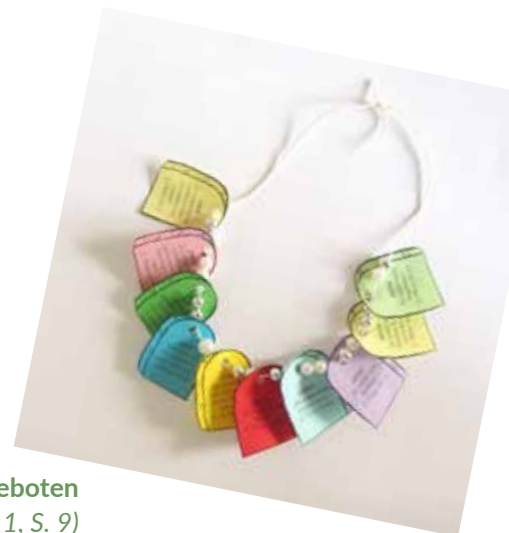
Halskette mit den Zehn Geboten

Anleitung: Drucken Sie die Tafeln mit den Zehn Geboten auf Tonkarton in verschiedenen Farben (oder drucken Sie sie auf weißen Karton und lassen Sie die Kinder die Tafeln bunt anmalen). Die Kinder sollen die Tafeln ausschneiden und Löcher in die schwarzen Punkte stanzen. Ziehen Sie einen Wollfaden in der richtigen Reihenfolge durch die zehn Tafeln und fädeln Sie dazwischen je zwei Perlen auf. Binden Sie die Enden zusammen, sodass eine Kette entsteht.